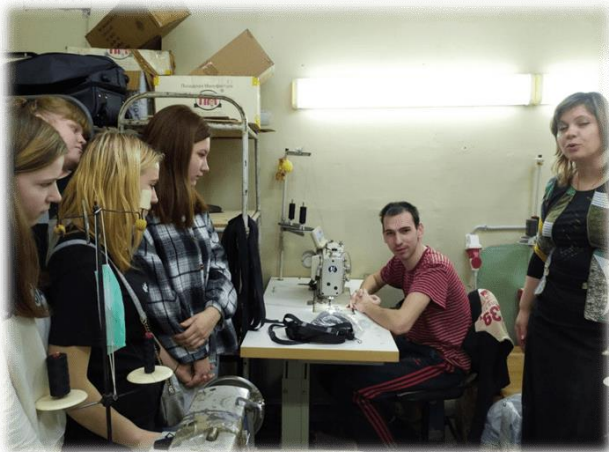
Фото отчет ПК «Камертон»